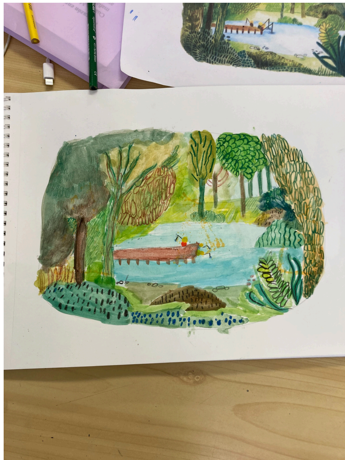
Paula, 7 años